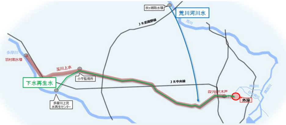
図3 外濠への導水ルートのイメージ

秋ヶ瀬取水堰 ⇒ 既存施設・新設導水路 ⇒ 玉川上水路 ⇒ 新設導水路 ⇒ 外濠